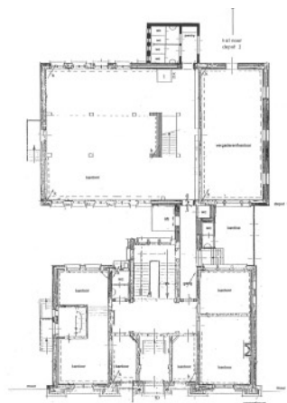
Plattegrond begane grond

Opdrachtgever: Interbuilding Company IV B.V. / BavoRNOgroep Project: Restauratie van het voormalig Rotterdams Gemeentearchief Gereed maken voor de huurder van de gebouwen als kantoorruimte en dagbehandelingcentrum voor psychiatrische patiënten. Architect: DEVRIES architectuur en interieurarchitectuur m.m.v. Maarten de Regt Oppervlakte: 1700 m 2 Status: gemeentelijk monument Start werkzaamheden: 1999 Opgeleverd: 2003