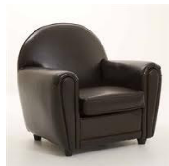
en een stoel