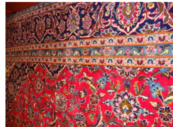
bank en carpet