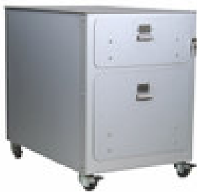
kastje onder tv