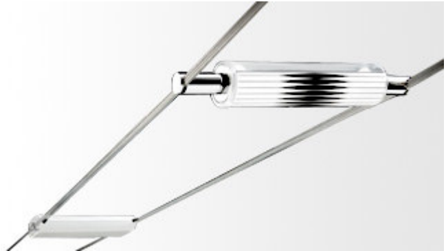
verlichting aan spankabels