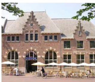
Bouwkundige ingreep hoofdentree